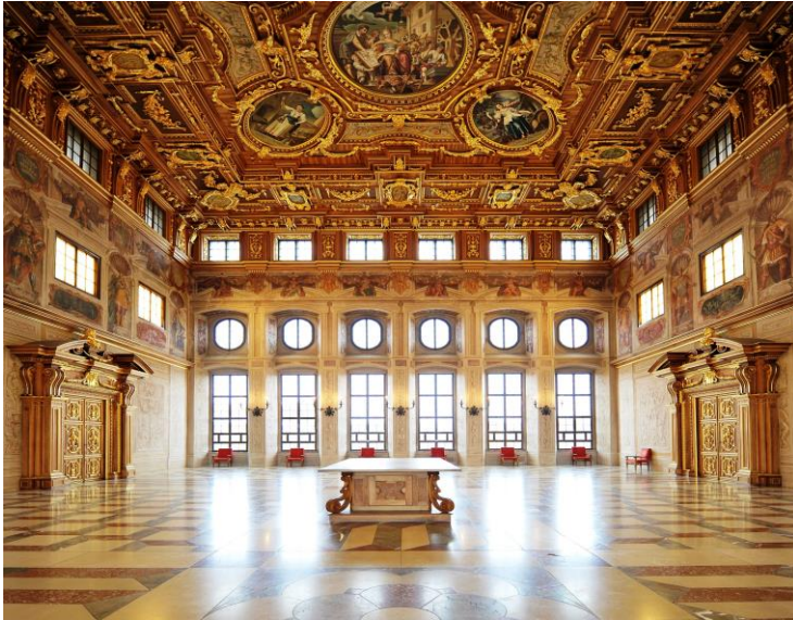
Das Rathaus & Goldener Saal

Das architektonisch und historisch beeindruckende Ausburger Rathaus und sein Goldener Saal gehören zu den bedeutendsten Profanbauten der Renaissance nördlich der Alpen